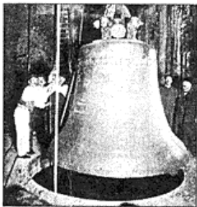
Dienstag, 28. Juni 1910: Im Michelturm wird die größte Glocke, 10 230 Kilo schwer, hochgezogen.